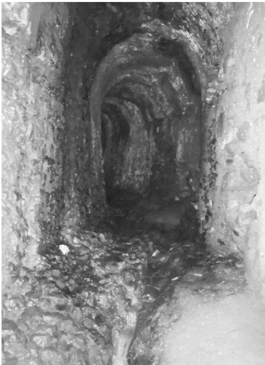
Fig. 11 - Secondo tratto attivo del Chiavicone della Suburra prima del suo sbocco nella Cloaca Massima sotto via dei Fienili.

lagamenti dovuti ad acque sorgive, pioggia e piene del Tevere. Inoltre il nuovo quartiere Alessandrino ad alta densità abitativa, necessitava di un sistema fognario efficiente, servito da un grande collettore. La ricostruzione di questo canale di drenaggio dimostra che, una zona situata in una valle anticamente percorsa da un torrente 11 , ricca di fonti idriche naturali e densamente abitata, se non viene drenata da un sistema fognario efficiente ritorna comunque ad allagarsi ed a formare una palude. Per po-