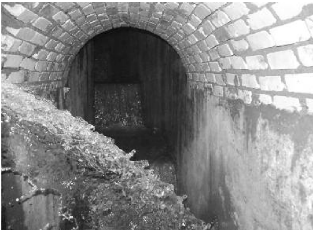
Fig. 7 - Serie di cascate per dissipazione dell'energia e perdita di quota nel tratto terminale del Chiavicone della Suburra, prima dell'immissione nella Cloaca Massima sotto via Tor de Conti.