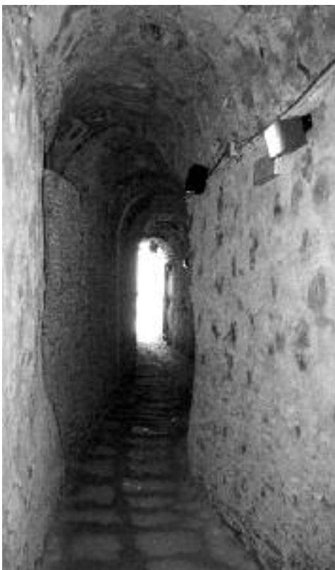
Fig. 3 - Segmento del Chiavicone della Suburra oggi, utilizzato come sottopasso pedonale tra i due tratti del Foro di Nerva, sottostante via Alessandrina e via dei Fori Imperiali.

Il Chiavicone della Suburra (Fig. 4) è stato costruito in gran