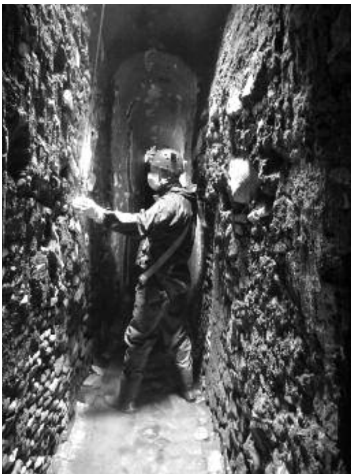
Fig. 4 - Chiavicone della Suburra ancora attivo sotto via Madonna dei Monti.