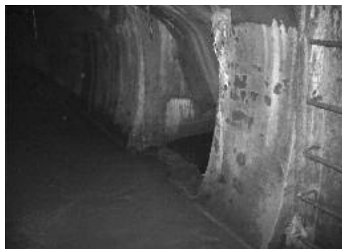
Fig. 6 - By pass del Collettore del Colosseo sotto via dei Serpenti, diretto nel Chiavicone della Suburra.

Nel tratto esplorato sotto via Leonina e sotto via Madonna dei Monti, il Chiavicone della Suburra riceve gli scarichi dagli edifici e dalle strade afferenti. Si possono notare due tratti di fognatura tra loro scollegati. Il primo dopo aver raccolto, tramite una fogna moderna, le acque provenienti da via Urbana e poi gli scarichi di via Leonina, all'altezza di via dei Serpenti, sbocca nella fognatura che corre sotto quest'ultima via e che rappresenta la parte iniziale del grande Collettore del Colosseo. Il secondo tratto ha origine dal Collettore sopra citato, ad una quota leggermente più alta del normale livello di scorrimento dei suoi liquami con la funzione di by pass delle