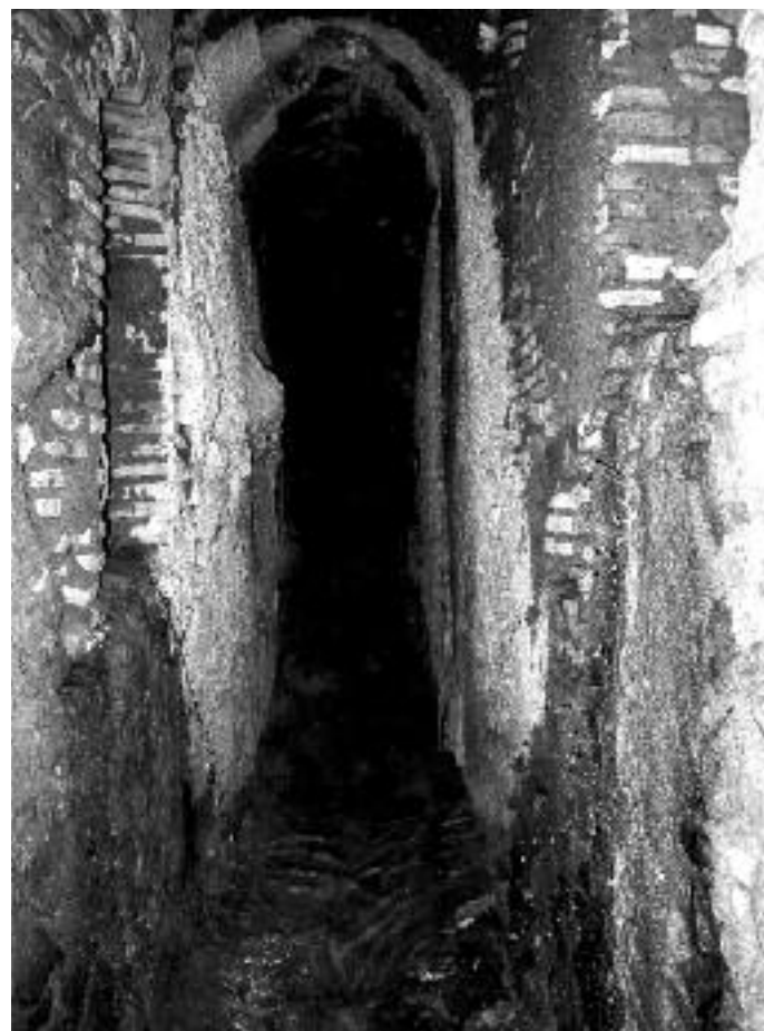
Fig. 5 - Chiavicone della Suburra ancora attivo sotto via Madonna dei Monti.

parte con materiali di riutilizzo provenienti dagli edifici romani crollati e/o demoliti per recuperare materiale edile. Le sue pareti sono formate da laterizio alternato a blocchi di tufo, frammenti di marmo e travertino di reimpiego, ma non mancano frammenti litici eterogenei e ceramiche, cementati con malta idraulica; la volta a botte è costruita in opera cementizia, mentre il piano di scorrimento dell'acqua realizzato con coppie di lastre di pietra appaiate presenta una lieve concavità nel centro (Fig. 5). Le misure, con frequenti variazioni, sono di circa m 3,60 in altezza e m 1,20 di larghezza.