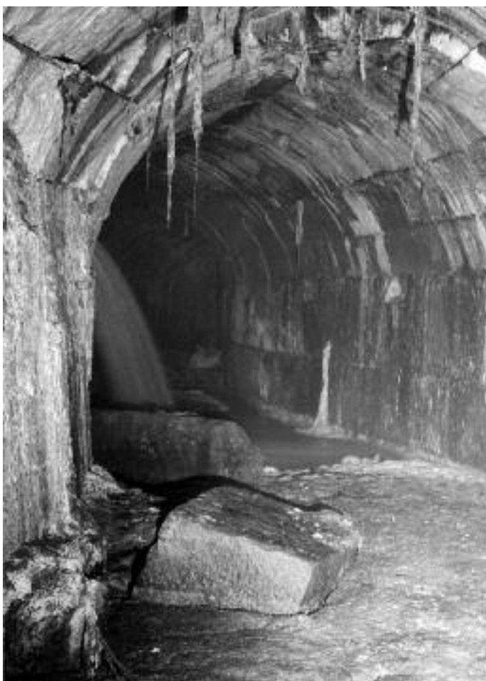
Fig. 9 - Resti del Chiavicone della Suburra (a sinistra) nel tratto ovest del Foro di Nerva.