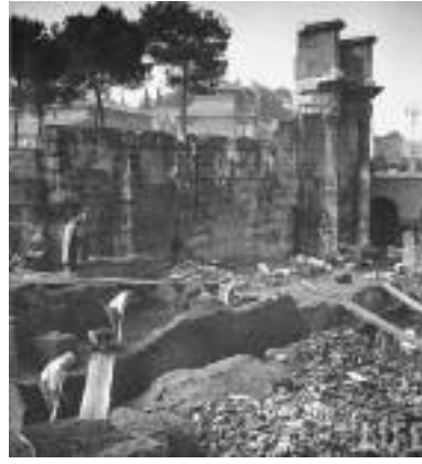
Fig. 1 - Scavo del Foro di Nerva (1940) visto da ovest, con resti del Chiavicone della Suburra in fase di demolizione.